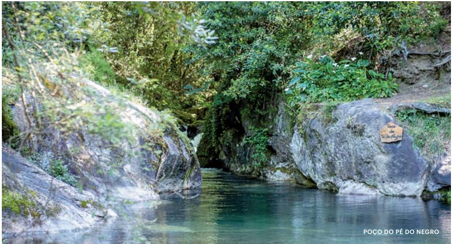
POÇO DO PÉ DO NEGRO

▲ Uma casa antiga e a sua adega reerguidas das cinzas transformaram-se num paraíso com vista para o vale