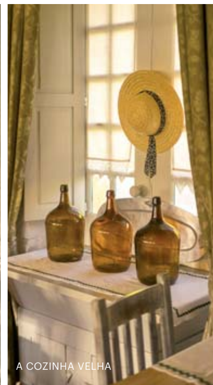
A COZINHA VELHA

Verdes com o seu néctar de vinhas com mais de cem anos.