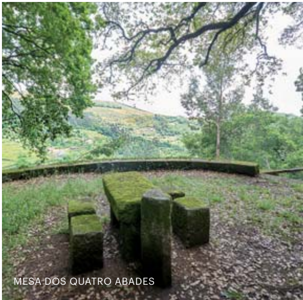
MESA DOS QUATRO ABADES