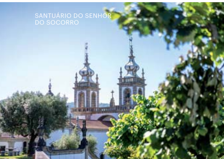
SANTUÁRIO DO SENHOR DO SOCORRO