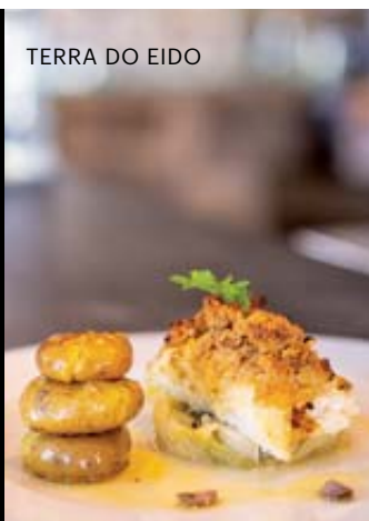
TERRA DO EIDO

Em Brandara e Arcozelo somos surpreendidos por cozinha de excelência