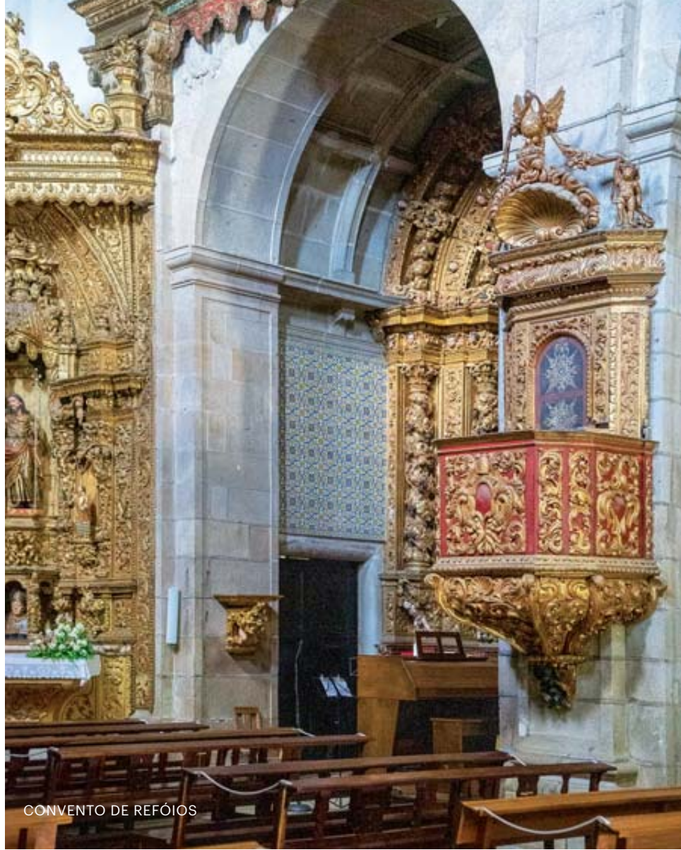
CONVENTO DE REFÓIOS

Sobre um penedo elevado atrás da capela, um objeto metálico em forma de pedra parece caído do céu. É uma obra do artista plástico André Banha, de onde podemos apreciar a vista através de janelas recortadas no metal.