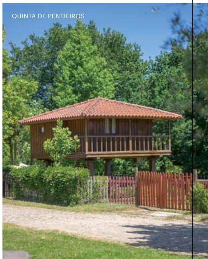
QUINTA DE PENTIEIROS

▶ A Quinta de Pentieiros é uma boa base de partida para a exploração das Lagoas de Bertíandos e São Pedro d'Arcos