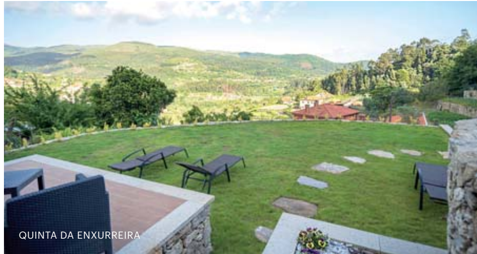
QUINTA DA ENXURREIRA

Para encontrar lugar de estada também não é preciso ir muito longe: debruçada sobre a paisagem do vale e com o caminho a passar mesmo ao lado está a QUINTA DA EN-