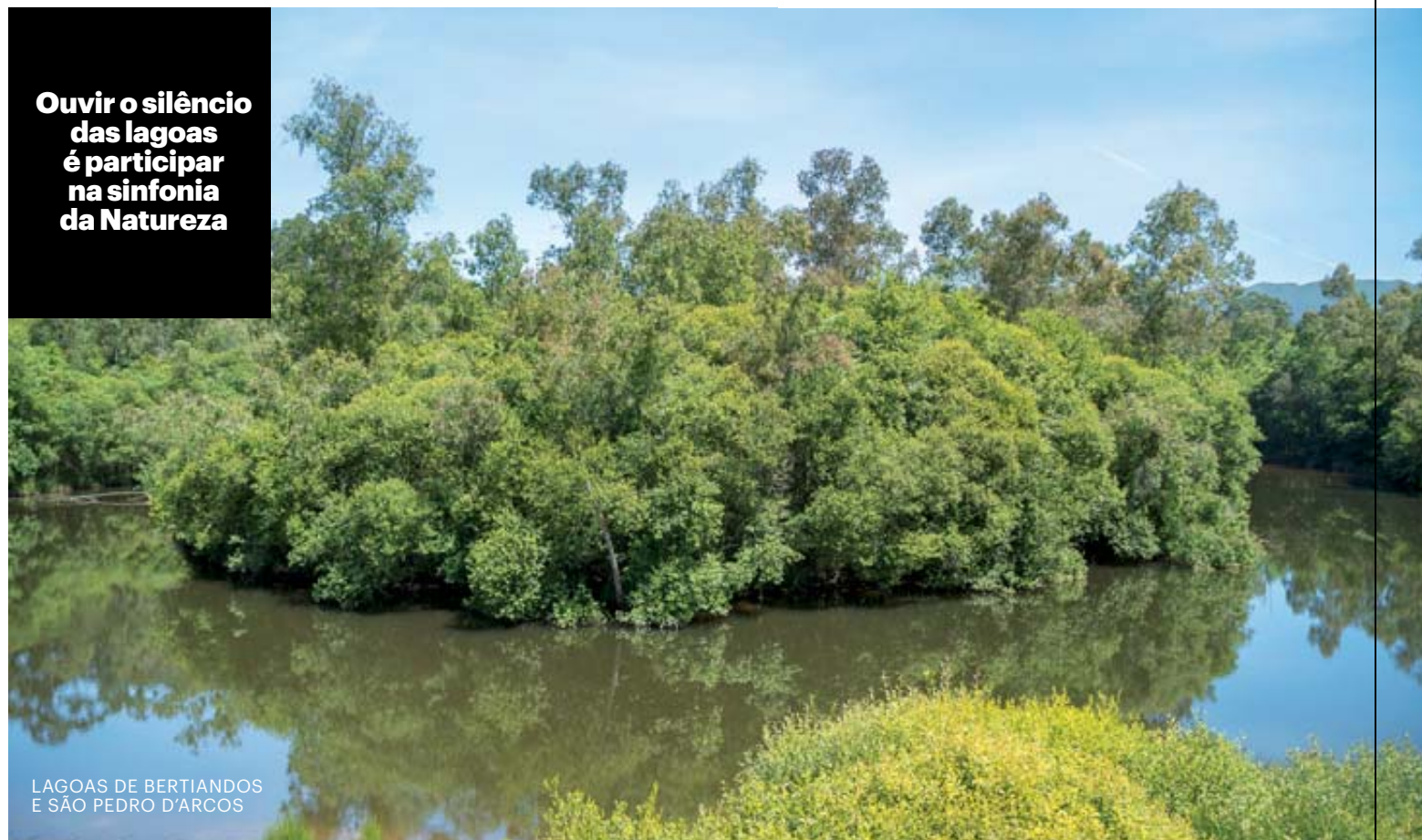
LAGOAS DE BERTIANDOS E SÃO PEDRO D'ARCOS

Ouvir o silêncio das lagoas é participar na sinfonia da Natureza